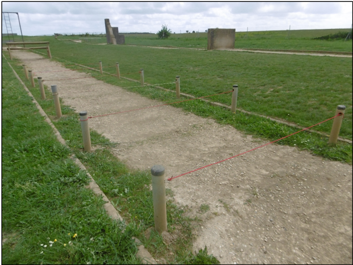
Obstacle n°03: Etat Actuel